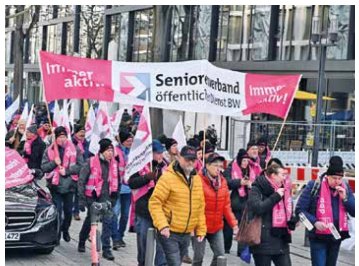
› Zahlreiche Seniorinnen und Senioren demonstrierten gemeinsam mit dem Seniorenverband sichtbar und lautstark ihren Unmut.

Aus allen Landesteilen reisten unsere Kolleginnen und Kollegen an, um den Druck auf die öffentlichen Arbeitgeber gemeinsam mit den aktiven Kolleginnen und Kollegen zu erhöhen. Viele waren dabei mit Fahnen und Transparenten im durchaus beachtlichen „Block des Seniorenverbands“ durch die Stuttgarter Straßen und bei der Abschlussveranstaltung nahe dem Landtag unterwegs,