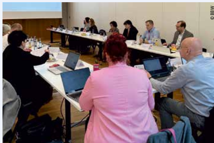
> Der Landesvorstand bei seiner Frühjahrssitzung in Kornwestheim

Der Wahlausgang war selbstverständlich auch Thema beim Landesvorstand des BBW, der am 24. März in Kornwestheim getagt hat. Besprochen wurde dabei auch das Wahlverhalten der Beamtinnen und Beamten im Land. Mit Blick auf die Zahlen der Forschungsgruppe Wahlen und von infratest dimap war für BBW-Chef Rosenberger die Feststellung wichtig: Die Beamtinnen und Beamten haben überproportional die etablierten Parteien gewählt und unterdurchschnitt-