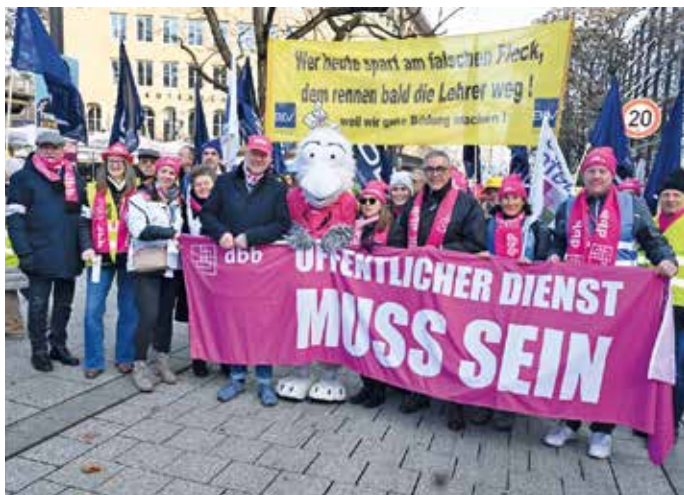
> Auch der „Block“ des Seniorenverbands zog durch die Stuttgarter Straßen.

auf die Beamtinnen und Beamten der Länder und Kommunen. Jedem Versuch, bei der Besoldung und Versorgung inhaltlich Abstriche zu machen oder die Umsetzung zu verzögern, werden wir uns massiv widersetzen“, machte der dbb Chef nach dem Tarifkompromiss deutlich.