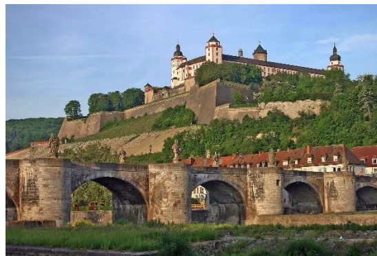
Marienfest Würzburg mit alter Mainbrücke

Mehrtagesreise vom 5. bis 9. Oktober 2023