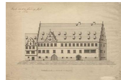
Das frühere Haus der Ulmer Sammlung